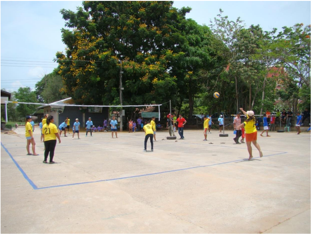
สนามกีฬาบ้านทับสวายพัฒนา หมู่ที่ 2